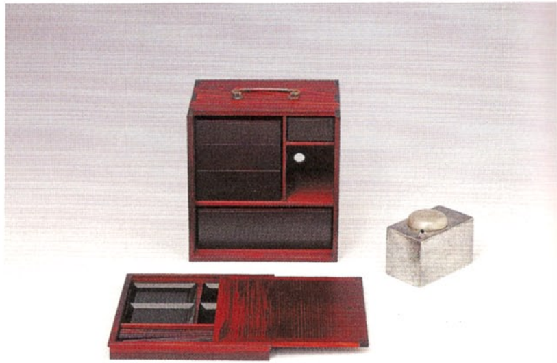
一七二 遊山箱—赤木明登 平成二〇年・2008