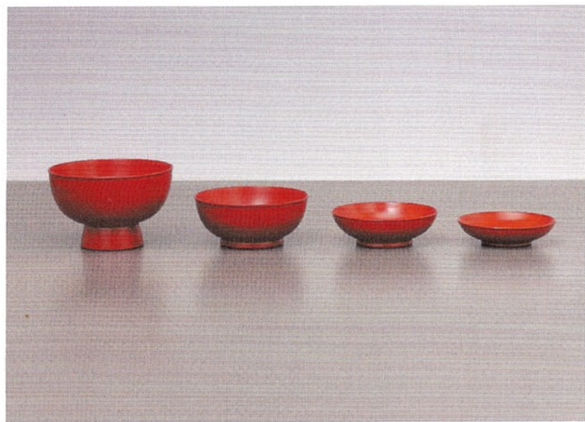
一七三 時代四つ椀—赤木明登 平成二一年・2009