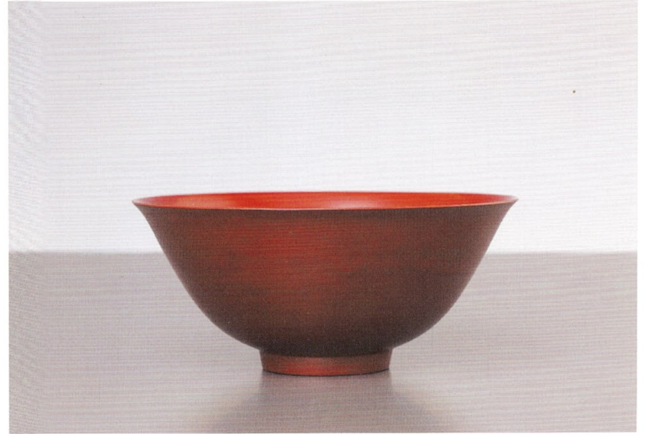
一七〇 葉反鉢—赤木明登 平成二一年・1999